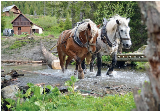
Das Pferd war in der Forstwirtschaft beinahe ausgestorben – heute bietet Longo mai Kurse für das schonende Holzrücken mit Pferden an.

Im Bauhandwerk haben sich viele in Longo mai ein breit gefächertes Wissen angeeignet. Es betrifft den Hausbau mit Naturstein, den Holz-, Stroh- und Lehmbau, aber sie beherrschen auch das Zimmerhandwerk, das Dachdecken, die Bauschreinerei bis zur Inneneinrichtung und die Installation von Elektrizität und Sanitäranlagen. Wie weit wollen wir diese Kompetenzen auf die Longo mai-Projekte beschränken oder sie als finanzielle Einnahmequelle nach aussen tragen? Diese Frage wird momentan diskutiert.