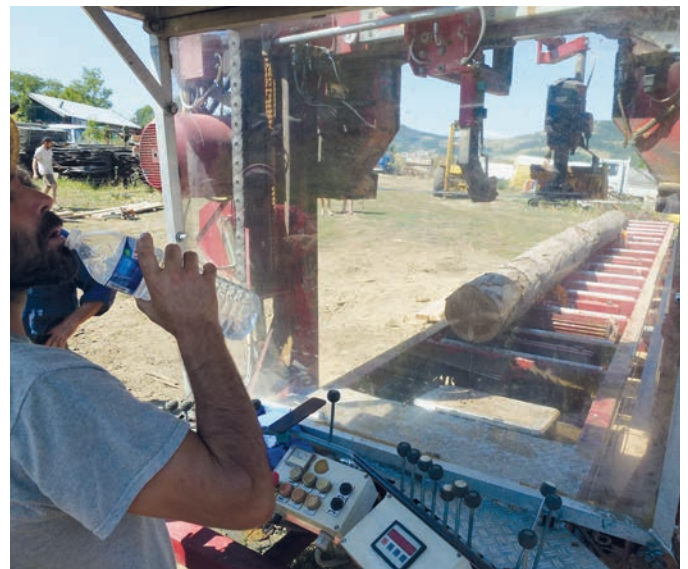
Das Sägehandwerk macht durstig. In der Kooperative Treynas wurde vor kurzem eine neue mobile Sägerei angeschafft.

Eine gezielte alternative Vermarktung ist genauso wichtig wie die Produktion. Hier braucht es bei uns noch viel Erfindergeist und Lernbereitschaft. Wir möchten einerseits wirtschaftlich vorwärtskommen, möchten aber nicht in den Sog der Marktlogik geraten. Hier gilt es das richtige Gleichgewicht zwischen Marketingpraxis und den Kriterien einer solidarischen Wirtschaft zu finden. Aber mit dem pragmatischen Vorgehen «Schritt für Schritt», wie wir es seit 40 Jahren tun, werden wir sicher den richtigen Weg finden.