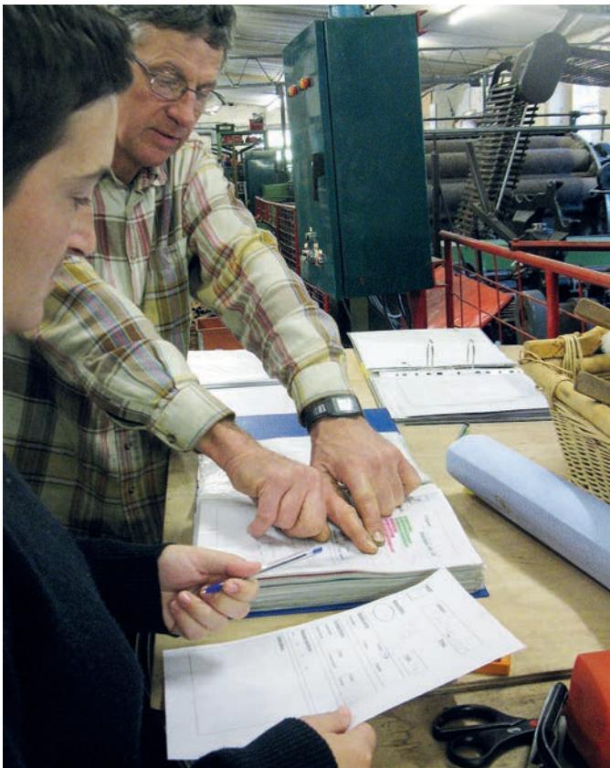
Eine Baustelle dieser Dimension muss gut geplant sein.